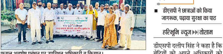
फसल अवशेष प्रबंधन पर उपस्थित अधिकारी व किसान।