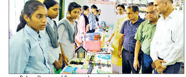
बवानीखेड़ा। विज्ञान प्रदर्शनी का अवलोकन करते हुए।