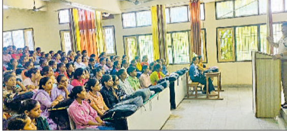
तोशा। एकत्रित छात्राओं को संबोधित करते हुए।