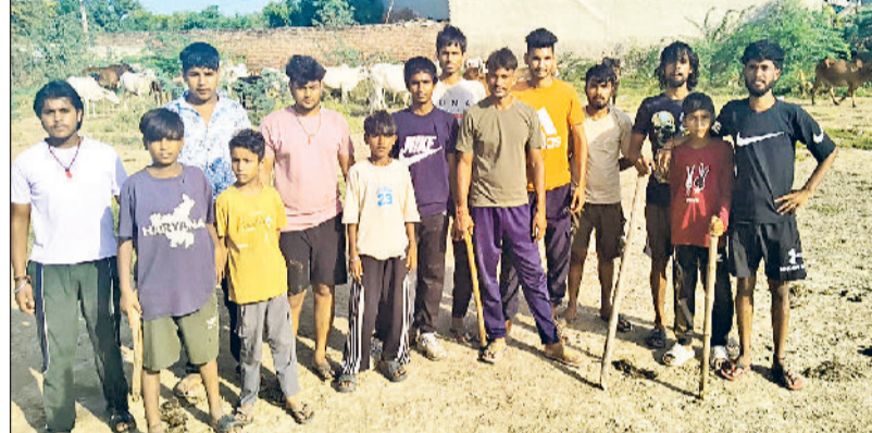
मिवाणी। अस्थायी बाड़े में एकत्रित गोवंश की सुरक्षा में खड़ा गोरक्षा दल का सदस्य।

श्राद्ध अमावस्या पर गोवंश को नहीं खिलाएं कच्चा एवं तला भोजन राकेश मट्टी मिवाणी 21 सितंबर को श्राद्धों की अमावस्या है, जिसका हिंदू धर्म में बहुत अधिक महत्व है। श्राद्ध अमावस्या को हर कोई पितरों की आत्मा की शांति के लिए दान पुण्य करता है, लेकिन लोग जाने अनजाने में गाय को तला हुआ एवं क्षमता से अधिक सामग्री खिलाकर पुण्य की बजाय पाप के भागी बन जाते हैं, इसलिए हर वर्ष गोरक्षा दल की टीम शहर में लोगों को जागरूक करती है। जागरूकता अभियान में नगर परिषद प्रशासन भी कंधे से कंधे मिलाकर कार्य करता है। गोरक्षा दल के सदस्य व प्रशासन लोगों को कच्चा व तला हुआ भोजन गोवंश को न खिलाने के लिए ऑटो रिक्शा लगाकर जागरूक कर रहा है।