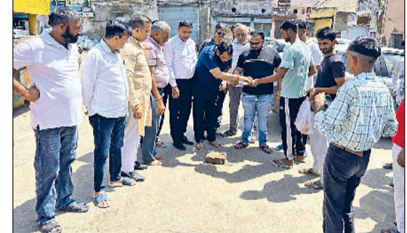
भवानी। जैन चौक इलाके में शौचालय के भवन का निर्माण कार्य शुरू करवाते हुए।

अन्य सामान लगवाए जाएंगे। साथ ही सफाई का विशेष ख्याल रखा जाएगा। ताकि शहर की स्वच्छता को और पंख लगाए जा सके। अब से पहले यहां पर कोई भी सार्वजनिक शौचालय नहीं था। सार्वजनिक शौचालय बनने के बाद लोगों को राहत मिलेगी। यहां यह बताते चले