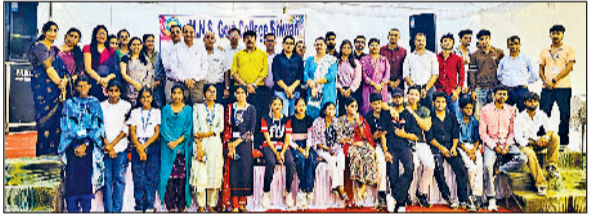
भवानी। आयोजित कार्यक्रम में उपस्थित प्रतिभागी व शिक्षक।

महाराजा नीमपाल सिंह राजकीय महाविद्यालय में शनिवार को प्रतिभा खोज कार्यक्रम का आयोजन धूमधाम और सांस्कृतिक उल्लास के साथ किया गया। इस कार्यक्रम में विद्यार्थियों ने नृत्य, गायन, अभिनय और अन्य कलात्मक प्रस्तुतियों के माध्यम से अपनी प्रतिभा का प्रभावाशाली प्रदर्शन किया। रंगारंग कार्यक्रम ने सभी दर्शकों का मन मोह लिया और मंच पर विविध रंगों की छटा बिखेर दी। कार्यक्रम में नाटक, कविता पाठ, हरियाणवी रागनी,