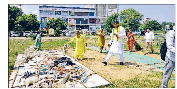
भिवानी। सफाई अभियान चलाते हुए।