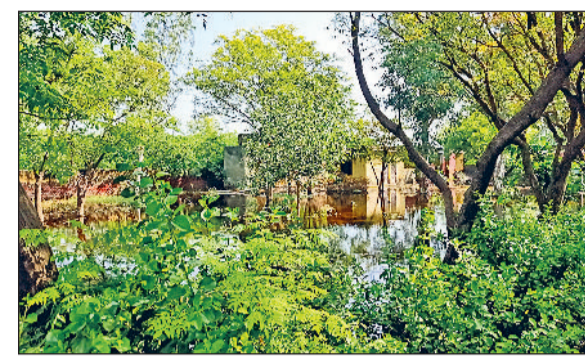
भिवानी। स्कूल परिसर में जमा पानी का दृश्य। फोटो : हरिभूमि

चोए का पानी जमा होने से विद्यालय पिछले काफी दिनों तक बंद रहा व बाद में विभाग के आदेश मिलने पर गांव के ही किसी निजी व्यक्ति के भवन में कक्षाएं लगाने की व्यवस्था की गई। लेकिन भवन में न तो बिजली, पानी, शौचालय, पंखे की व्यवस्था है जिसके कारण सभी को खाली परेशानियों का सामना करना पड़ रहा है।