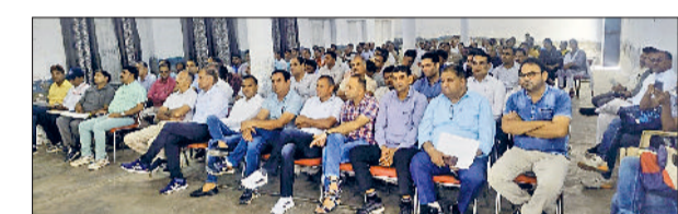
भिवानी। खेलों को लेकर आयोजित बैठक में उपस्थित शिक्षक।