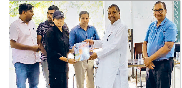
बहल। सेवा पखवाड़े के दौरान आईटीआई में पुस्तक वितरित करते हुए पूर्व सरपंच।